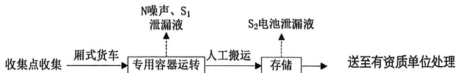
图 5-1 工艺流程图