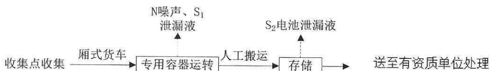
图 5-1 工艺流程图